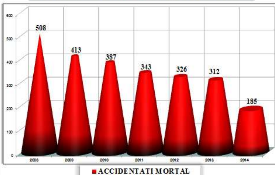
EVOLUȚIA ACCIDENTAȚILOR MORTAL ÎN MUNCĂ PE ANI DE PRODUCERE